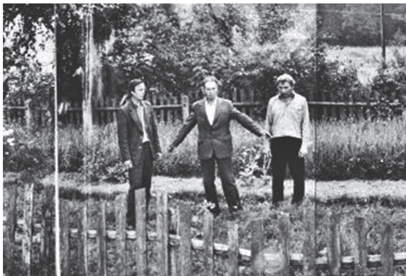
Єврейське масове поховання у серпні 1987 р. до ексгумації жертв.

The Jewish mass grave in August 1987 before the exhumation of the victims.