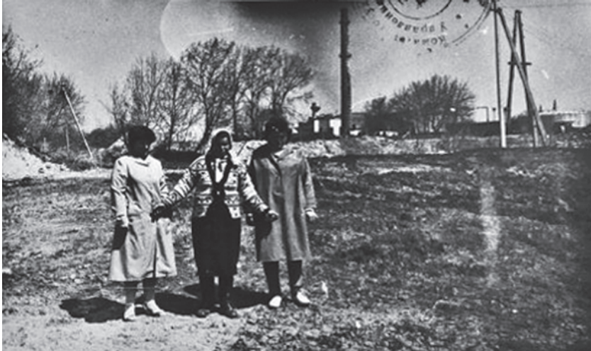
Під час огляду території у квітні 1988 р. свідок показує місце, де розстріляли ромів. During a site inspection in April 1988 an eyewitness points out the spot where the shootings of Roma took place.