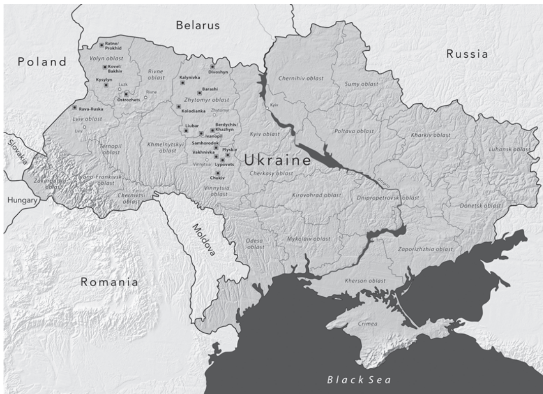
Map of the “Protecting Memory” project sites

During the German occupation, from 1941 to 1944, over one million Jews and more than 12 thousand Roma were murdered and hastily buried in mass shooting operations throughout the territory of what is today Ukraine. Estimates suggest there more than 2,000 mass shooting sites on the territory of contemporary Ukraine. In remote ra-