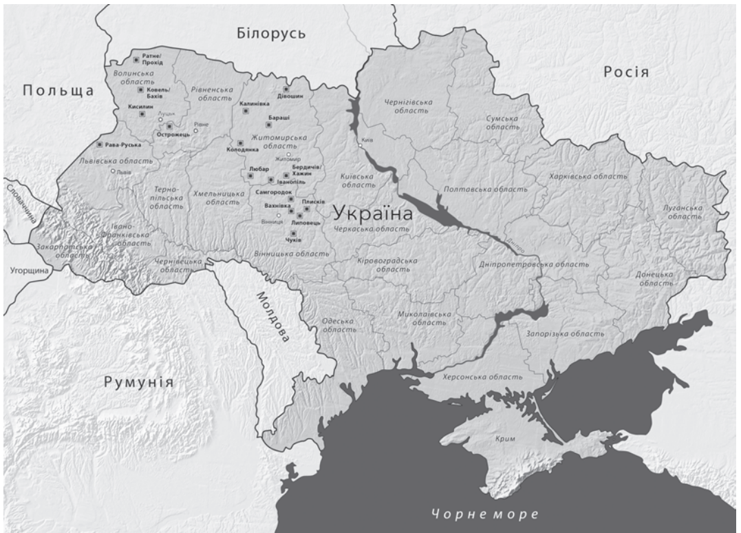
Місця проекту «Захистимо пам'ять»

У період німецької окупації 1941–1944 років на території сучасної України під час масових розстрілів було вбито понад мільйон євреїв та понад 12 тисяч ромів. На території сучасної України знаходяться понад дві тисячі місць масових розстрілів. У віддалених ярах, лісах, посеред полів, у колишніх протитанкових ровах чи піща-