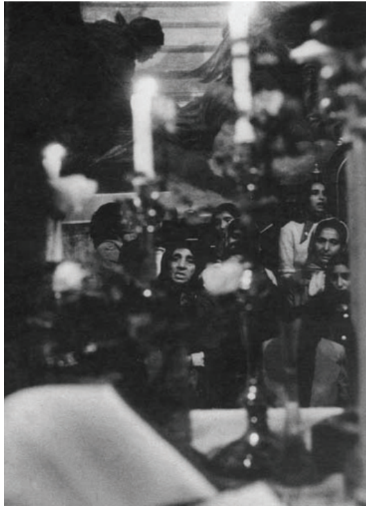
Угорські ромські жінки в католицькому храмі

Етнічна група ловарі сформувалася на теренах Австро-Угорщини. В їхньому діалекті крім румунських запозичень простежується вплив угорської мови. Вже в середині XIX століття ловарі здебільшого були міським населенням. Вирізняються високою мобільністю. На думку інших ромів, багато жінок ловарі, які проживають у містах, одягаються занадто сучасно. Чоловіки цієї групи займаються бізнесом. З іншого боку, вони зберігають відданість рідній мові й родинним традиціям. Донині не з'ясовано, як з'явилася назва цієї групи. Одні дослідники вважають, що від ромського слова «лове» (гроші), вважаючи, що в цьому відбилася заможність ловарей. Інші стверджують, що назва походить від угорського слова lo' (множина – lovak ) – кінь. На думку цих етнографів, ловарі в минулому були вдалими торговцями кіньми.