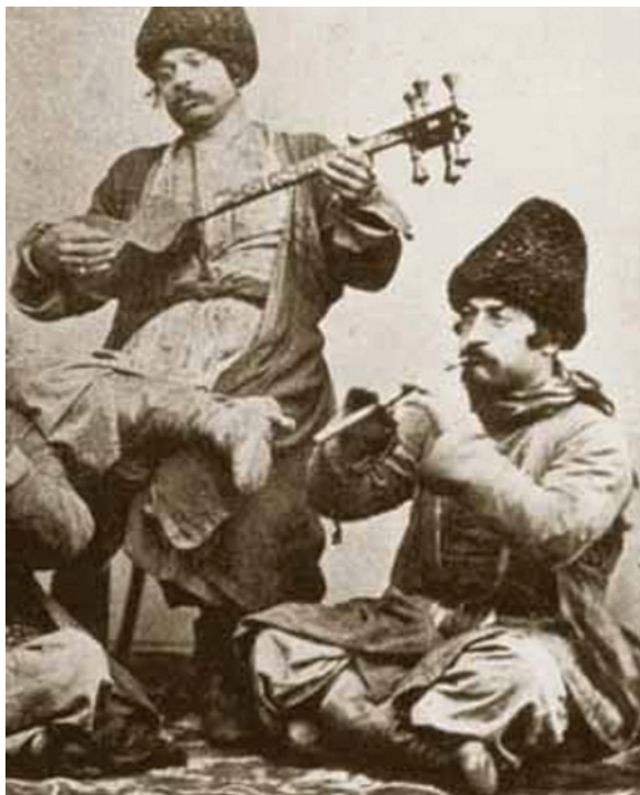
Роми-боша із Закавказзя. Друга половина XIX ст.

Закавказькі роми-християни відомі під назвою боша . Вони сповідують вірмено-григоріанське православ'я. Етнонім «боша» виник порівняно недавно, на початку XIX століття – вірменською він означає «бродяга». У мову бошів було також запозичено вірменську граматику. Висока ступінь мовної асиміляції є доказом дуже давніх контактів цієї групи ромів з вірменами. Що ж до походження боша, то, найімовірніше, вони належать до тієї частини ромів, яка осіла в Закавказзі, не дійшовши до Візантії. У словнику мови боша немає грецьких запозичень.