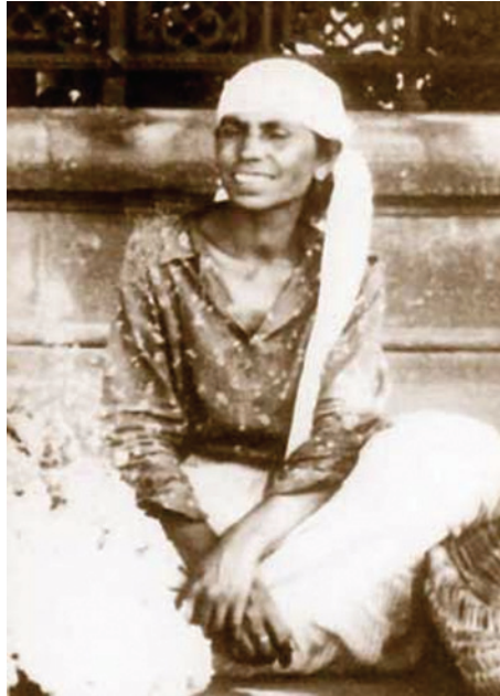
Румунська ромська жінка, яка торгує квітами. 1938 р.

Етнічна група келдерари – одна з найчисленніших і найпоширеніших в усьому світі. Вони формувалися і проживали до середини XIX століття в Румунії, на румунсько-угорсько-сербському мовному кордоні. Основне заняття ромів цієї групи – виготовлення і лудіння котлів, що і відбилося в їхній самоназві (від рум. caldarag – казаняр, лудильник). Це заняття келдерари не залишили донині, хоч би де вони проживали. Існує також етнонім котляри , поширений переважно у Росії. Із середини XIX століття почався масовий вихід ромів цієї групи з місць колишнього проживання і розселення по всьому світу. Причини, найпевніше, пов'язані зі зміною соціально-економічних умов. Збільшення чисельності ромів та обмежений ринок збуту змушували їх освоювати нові території.