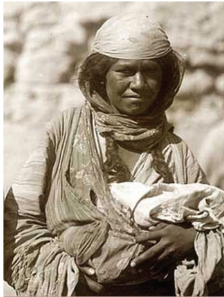
Ромська жінка із Середньої Азії. Початок XX ст.

Люлі , що живуть сьогодні в Узбекистані й Таджикистані, є нащадками ромів, які осіли там відразу після виходу з Індії. Вони не дійшли до Візантії і потрапили у сферу впливу ісламської культури, втім, так і не підкорившись їй до кінця. Втративши мову, люлі пронесли крізь століття традиційний спосіб життя. Їхні традиційні заняття – кустарні ремесла, зокрема, ювелірне, торгівля тваринами, ворожіння, збирання вторинної сировини, жебрацтво, музика. Самоназва – мугат .