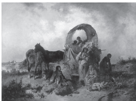
2. Адольф Ван дер Венне, австрійський художник. Цигани на привалі (друга половина XIX ст.)