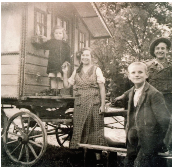
Родина німецьких сінті біля фургона. 1930-ті рр.

До етнічної групи сінті (в однині – сінто ) належать роми, які проживають довгий час (приблизно з XV століття) переважно в німецькомовних країнах. Самоназва сінті, ймовірно, походить від імені воеводи «Сіндел» – він привів перший табір до Німеччини. Ще одна гіпотеза пов'язує назву німецьких ромів із провінцією Сінд в Індії. У мові сінті дуже багато запозичень із німецької; їхні прізвища теж найчастіше звучать на німецький лад (наприклад, Ебергардт, Кляйн). За віросповіданням вони здебільшого католики. Саме сінті були предками так званих російських циган: наприкінці XVII століття частина кочівників перемістились до Польщі і далі в Російську імперію. Ті, що залишились у Німеччині, дочекалися покращення державного ставлення і намагалися стати частиною німецького суспільства. Значна їхня частина осіла, діти пішли до школи, юнаків призивали в армію і на флот. Сінті оволоділи виробничими професіями, деякі працювали у сфері мистецтва. Сильного удару їм завдав прихід до влади нацистів. Більша частина сінті загинула в концтаборах.