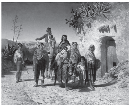
3. Ахілл Зо, французький художник. Іспанські цигани, які кочують Кордовою (друга половина XIX ст.)