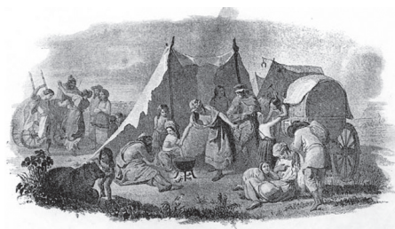
4. Циганський табір. Гравюра за малюнком Тараса Шевченка (друга половина XIX ст.)