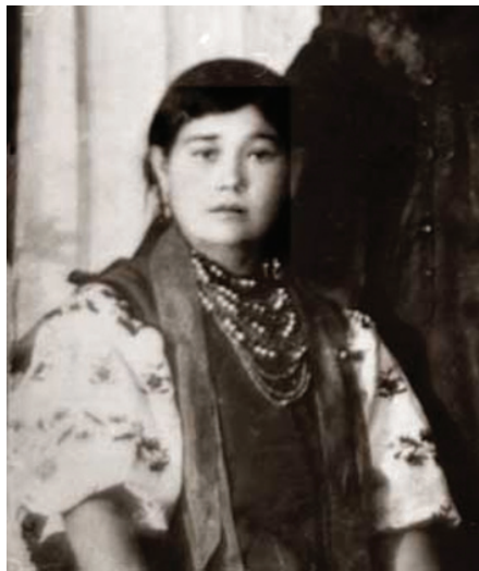
Українська ромка-сервиця. 1930-ті рр.

Етнічна група серви (в однині – серво ) остаточно сформувалася в ареалі поширення української мови. Аналіз сервицького діалекту свідчить, що найбільше запозичень іде з румунської мови. Можна припустити, що предки сервів тривалий час жили на теренах сучасної Молдови. У мові сервів простежується і словацький вплив. Крім того, в Східній Словаччині досі живе нечисленна група ромів, яку називають «сервитіка рома». За два-три століття серви дуже багато чого запозичили в одязі, звичаях і обрядах, фольклорі. Українські роми дуже славляться своїм співом, причому прекрасно співають українські народні пісні, майже не виконуючи власне ромський фольклор. Серед українських ромів було багато торговців кінями. Уже в XIX столітті більшість сервів жили осіло, мали великі будинки та стайні. Сучасні серви діляться на українських і поволзьких. Українські теж мають підгрупи – коваля і хохли. Ті, котрі осіли раніше, вже зовсім не розмовляють ромською. Інші знають мову, хоча і вживають багато українських запозичень. За віросповіданням серви православні.