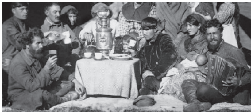
Руська рома п'ють чай. 1927 р.

Російські роми вели напівосілий спосіб життя, зимуючи в селянських хатах. Основними заняттями були торгівля кінями у чоловіків і врожіння, що супроводжувалося жебрацтвом, у жінок. Крім того, дуже популярним у російського населення був ромський народний спів. У багатьох містах Росії участь у хорі давала ромам достатній заробіток. За віросповіданням роми цієї групи переважно православні. Характерно, що представники расейців дуже багато запозичили від російської культури, зокрема, в їхній сучасній мові багато російських запозичень. Крім того, з моменту появи на території Росії вони почали носити російський одяг і співати російські пісні.