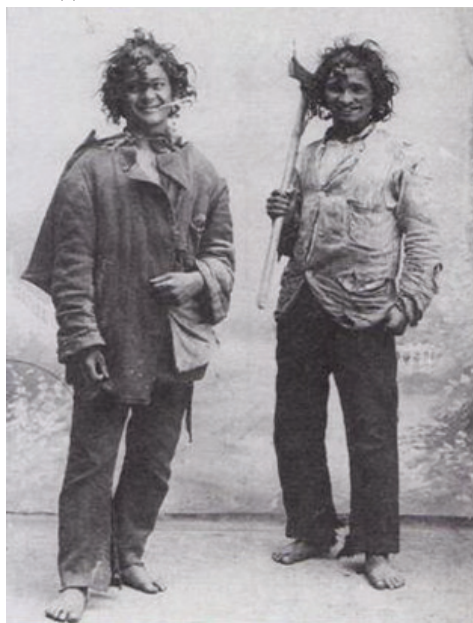
Ромські ремісники, які виготовляли дерев'яні корита. Угорщина, 1905 р.

Це балканські роми, які проживають у Румунії і сусідніх із нею країнах. Вони православні християни, які розмовляють одним із діалектів румунської мови. У минулому добували золото на берегах річок і розробляли руди. Від цього заняття походить і назва (румунською і сербською ruda означає рудник, шахта). Друга назва – лінгурари – на перший погляд, ніяк не пов'язана з першою (рум. lingura – ложка). Вважають, що обробкою дерева вони займалися ще тоді, коли мили золотий пісок. У зимовий період, коли річки замерзали або вода була дуже холодною, ці роми вирізали на продаж ложки, ополоники, веретена, корита. Пізніше друга професія стала основною. Лінгурари кочували у критих фургонях, запряжених волами, і возили із собою все необхідне для обробки дерева. Їхній одяг зазнав настільки сильного впливу з боку румунського, що майже не відрізняється від нього. Згодом і ці кочівники почали осідати, утворюючи селища або слободи.