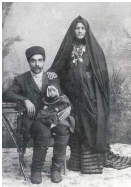
Роми-мусульмани з Криму. Фото початку ХХ ст.

На початку ХХ століття про кримів писали, що як ремісники вони мають у місцевого населення великий попит, до них ставляться як до чесних і корисних трудівників. У різних джерелах зазначено, що кримські роми – дуже корисні й перейняли багато у татар. Однак ромські жінки не сиділи вдома, а займалися торгівлею – продавали сурму (косметичний засіб для очей) та інші косметичні засоби. Цікаво, що торгівля косметикою аж до останнього часу була одним з основних заробітків у кримських ромських жінок, і це не дивно, якщо згадати, яким дефіцитом вона стала в роки соціалізму. За час проживання серед мусульман мова кримських ромів значно змінилася. У складі їхнього діалекту близько третини слів із коріннями, запозиченими з кримськотатарської мови. Відкритим лишається питання, коли кримські роми прийняли іслам. Деякі дослідники вважають, що це сталося після приходу в Крим, але найпевніше частина стала мусульманами ще на Балканах, у період турецького панування. Тож цілком зрозумілою є їхня міграція до Криму після поразок Османської імперії – це виглядає як перекочування до одновірців.