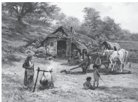
1. Тадеуш Рибковський, польський художник. Циганська родина біля вогнища (1894 р.)