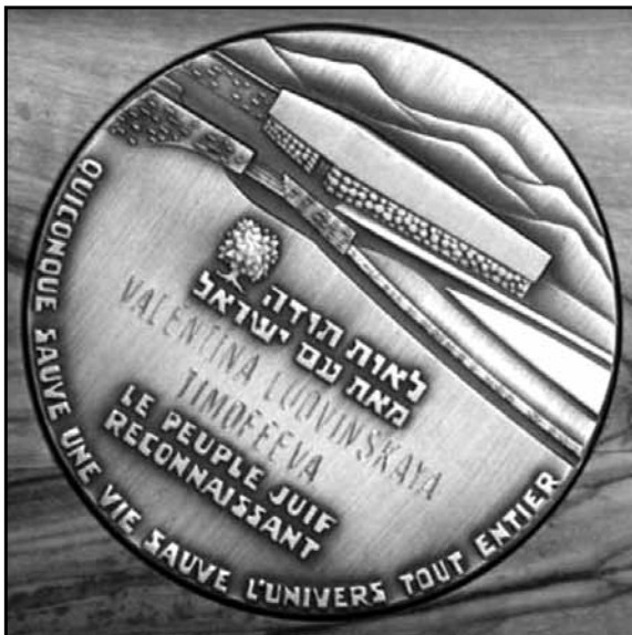
Медаль Праведника світу Людвінської Валентини Лаврентіївни.