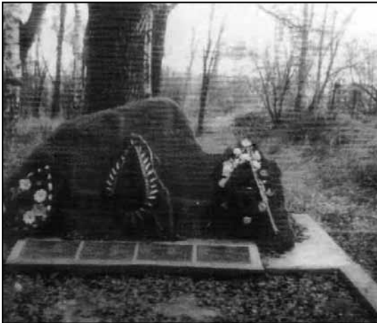
Меморіальна плита на місці масового поховання євреїв (військове стрільбище біля р. Прут). В липні 1941 р. тут по-звірячому було розстріляно представників єврейської громади міста.