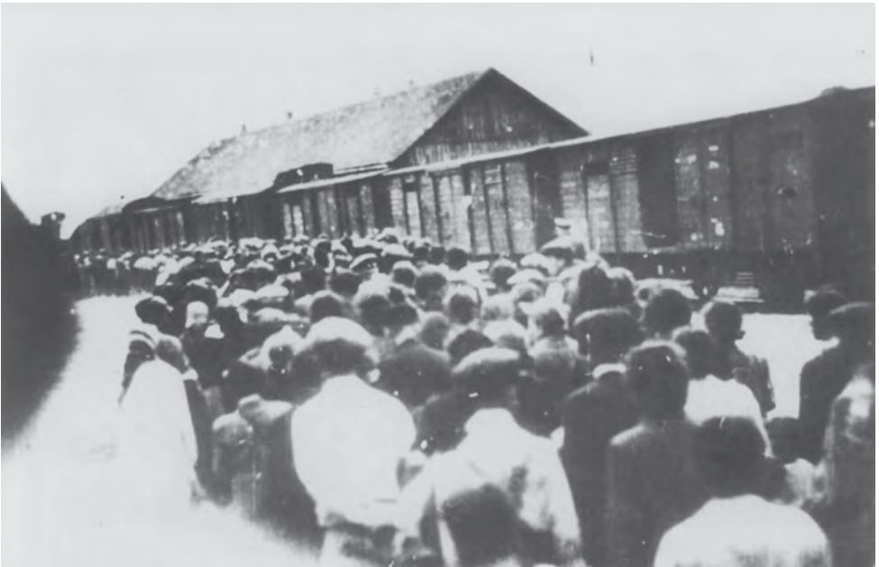
Депортація з Коломиї. Вересень 1942 р. Фотографії зроблені з укриття, імовірно-ше, членом польського руху опору.