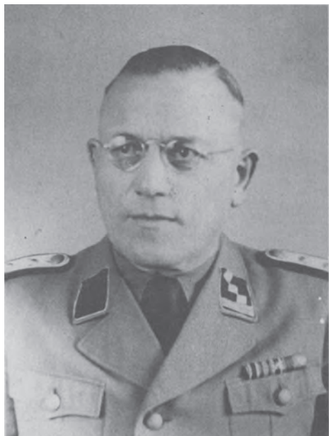
Готтліб Герінг — другий комендант табору смерті у Белжеці у період із серпня 1942 до червня 1943 р. Регіональний музей у Томашеві-Любельському (Muzeum Regionalne w Tomaszowie Lubelskim)