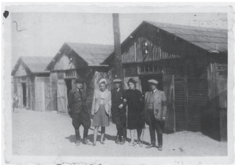
Єврейські в'язні з Табору I в осередку смерті у Белжеці. Регіональний музей у Томашеві-Любельському ( Muzeum Regionalne w Tomaszowie Lubelskim )