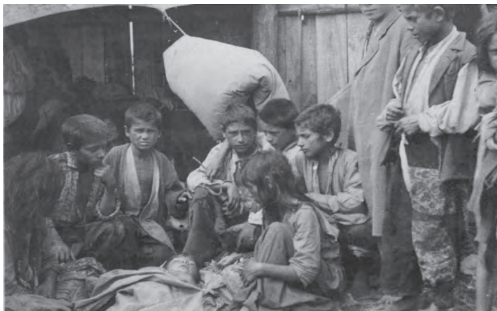
Ромські діти у таборі праці у Белжеці, 1940 р. Регіональний музей у Томашеві-Любельському ( Muzeum Regionalne w Tomaszowie Lubelskim )