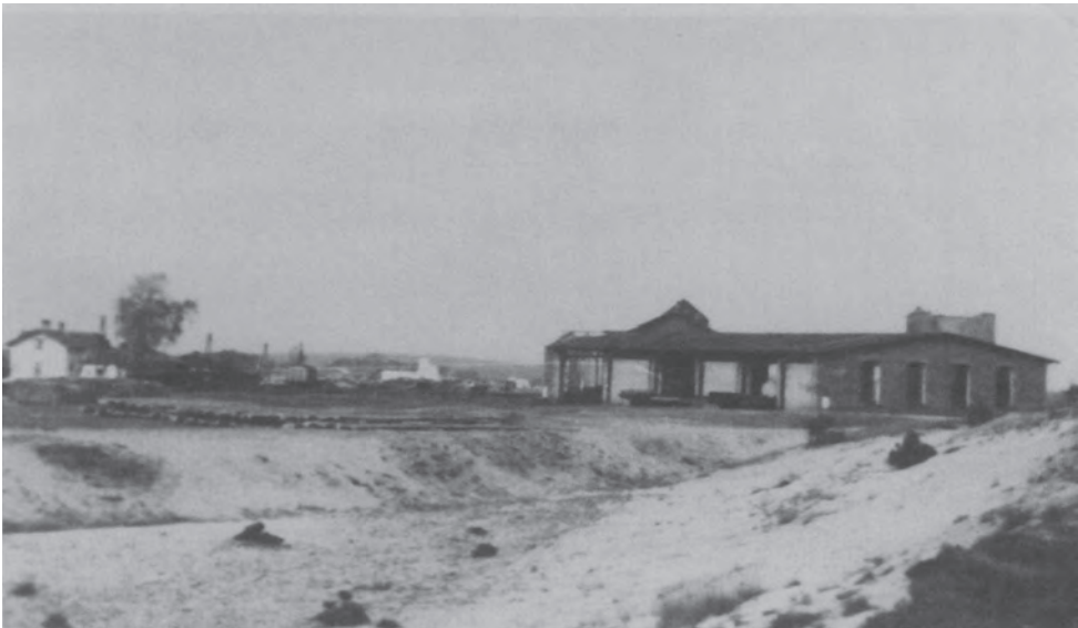
Вид на депо, в якому сортувалося майно депортованих євреїв, 1945 р. Вдалечині видно руїни залізничної станції, яку розбомбили у липні 1944 р. Єврейський історичний інститут (Żydowski Instytut Historyczny)