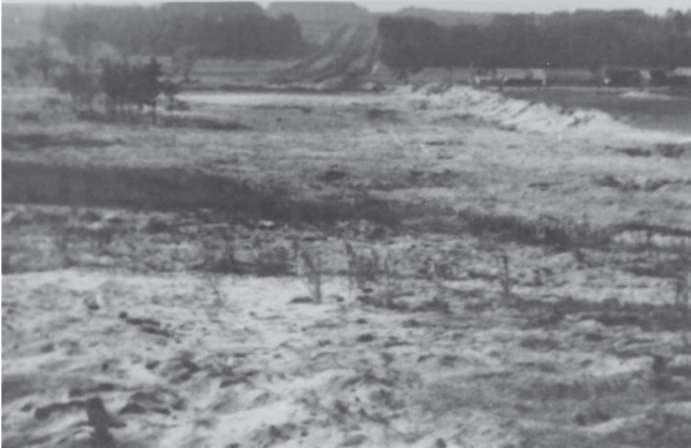
Територія колишнього табору смерті у 1945 р. З правого боку видно рештки протитанкового валу, який розділяв Табір I і II. Єврейський історичний інститут (Żydowski Instytut Historyczny)