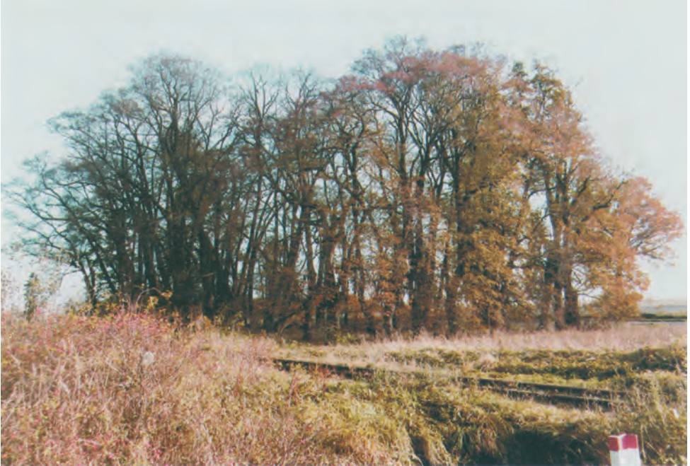
Колишній парк у Белжеці. У 1940 р. у двох масових могилах, розміщених між деревами, ховали тіла ромів і сінгі, вбитих і померлих у таборі праці.