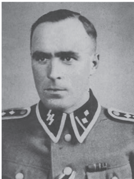
Готтфрід Шварц — заступник комендантів Крістіана Вірта та Готтліба Герінга. Регіональний музей у Томашеві-Любельському (Muzeum Regionalne w Tomaszowie Lubelskim)