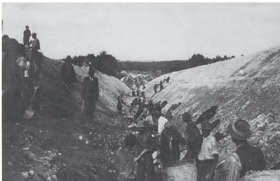
Белжець, 1940 р. Спорудження протитанкового рову.