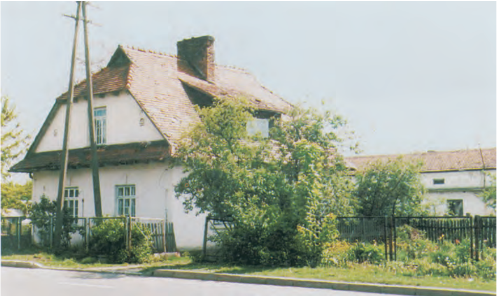
Сучасна світлина комендатури табору смерті у Белжеці. У глибині видно будинок, у підвалах якого переховували коштовності та гроші, награвані у жертв.