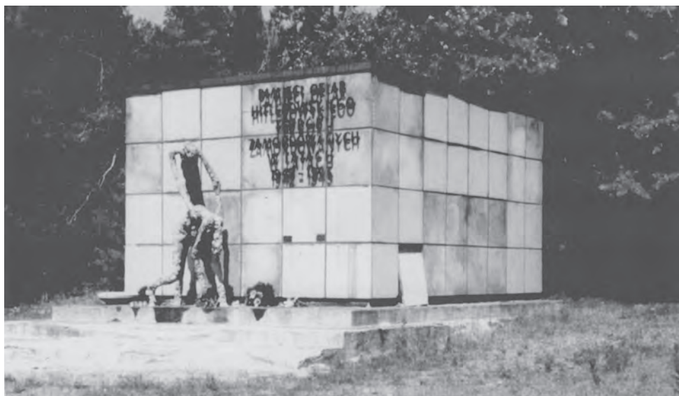
Старий пам'ятник у Белжеці авторства Станіслава Стшижинського.