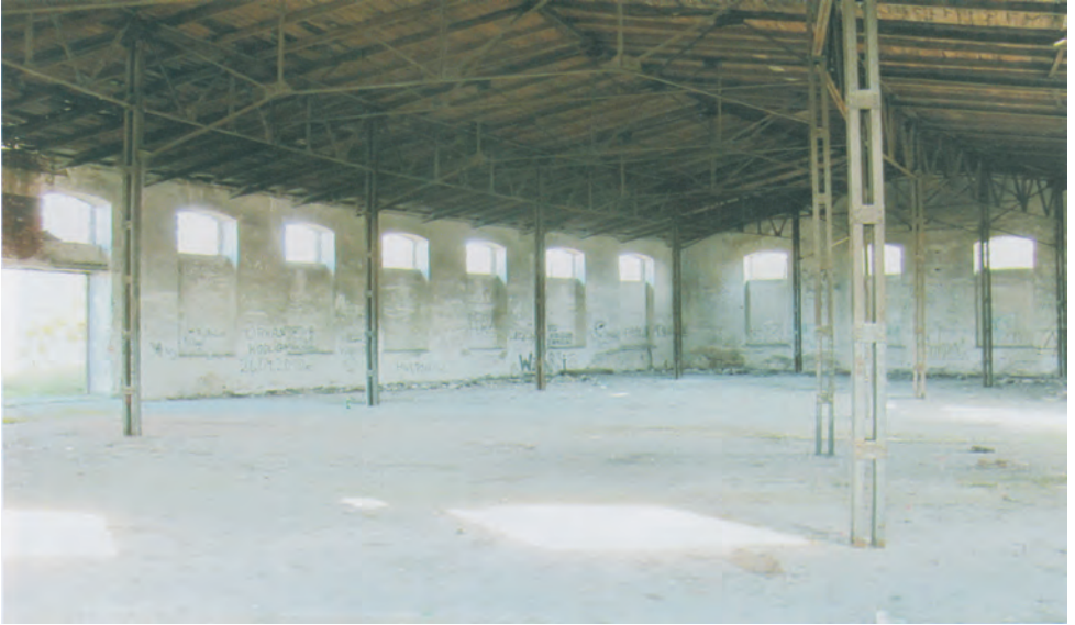
Сучасний вигляд внутрішньої частини колишнього депо.