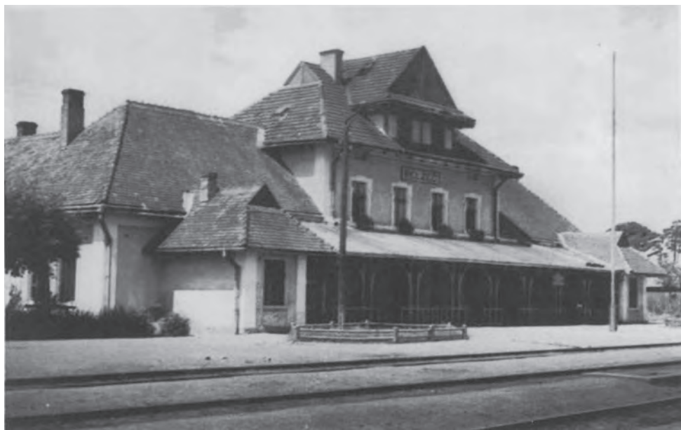
Будинок залізничної станції у Белжеці, куди прибували всі транспорти з депортованими євреями. Нині не існує. Регіональний музей у Томашеві-Любельському (Muzeum Regionalne w Tomaszowie Lubelskim)