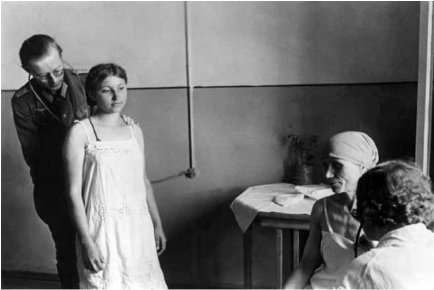
Українських примусових робітників перевіряє лікар Вермахту перед депортацією до Райху, 1942 р. (Ullstein Bild № 0659134).

та повної співпраці усіх причетних служб» 100 .