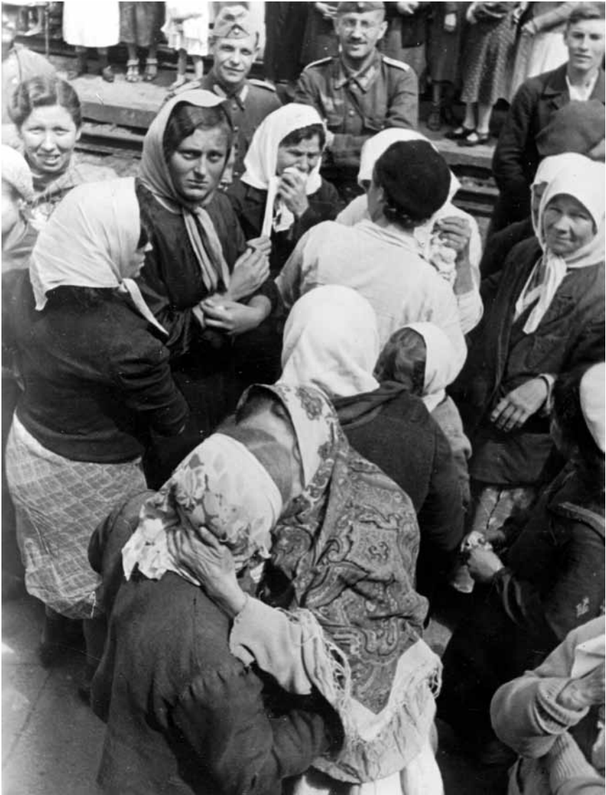
Українські примусові робітники прощаються із рідними на залізничній станції, 1942 р..

дель та начальник СД Бердичева обговорили майбутнє козятинського табору і прийняли рішення очистити табір від «ледачих елементів та тих, хто уникає праці». «Невідповідних» в'язнів передавали в руки СД та вбивали, а кваліфікованих робітників призначали на роботу на німецькій залізниці та на приватні фірми 109 .