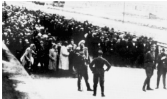
Селекція євреїв у Освенцимі

А.Эйхман является олицетворением нацистского чиновничества, символом всего отвратительного, против чего выступила тогда лучшая часть западного общества, добившаяся именно в 60-х реальной защиты прав человека, реального равенства прав религий и наций, реальной социальной защиты. Ведь это был, с буржуазной точки зрения (которая нынче в СНГ считается мерой всех вещей, вот доперестраивались), высокорядочный человек, отличный семьянин, специалист, наконец, замечательный организатор. А, что до банальности – сие не преступление... Сегодня в мире крайне распространена некая индивидуализированная банальность, когда человек выглядит довольно оригинально, но существует, мыслит и действует только под влиянием массового общества. Нескончаемые отдельные семьи тоже становятся банальностью. И слишком часто поведение человека подобно поведению маленькой девочки, чьи банальные родители в погоне за заработками не успевают общаться даже друг с другом, не то что с нею. А она увидела на экране телевизора курящую красавицу и принялась поджигать сигареты отца... Дабы выглядеть не ба-