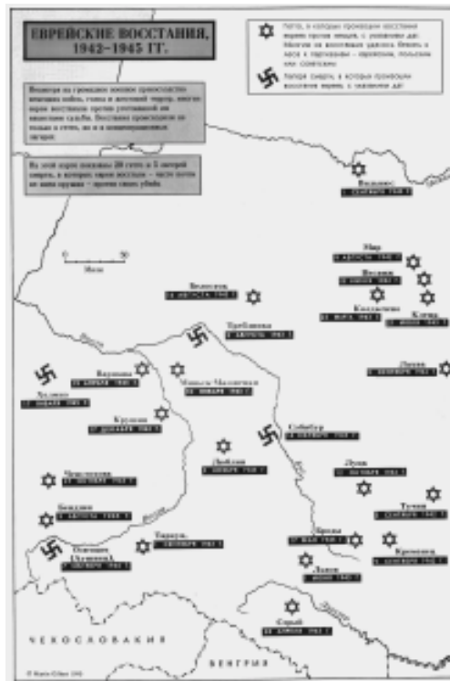
(Мартин Гилберт «Атлас по історії єврейського народу», 1990 г.)

Повстання гетто заслуговує поваги, але не обов'язково за те, про що найчастіше говорять. Як виявилось, воно не було поштовхом до подібних дій під час тієї ж війни. Мине багато часу, і в Ізраїлі воно стане моральною запорукою вчинків героїчних, але не завжди справедливих. Нема сумніву, в бунті виявляється людська гідність, але ж не тільки в ньому. Великий радянський письменник Василь Гроссман, оплакавши загальну пасивність єврейських жертв, стверджує: «Славні повстання гетто у Варшаві, Трєблінці, Собіборі (...), всі вони довели, що інстинкт волі в людині непереможний». А Жан Америкі, що перейшов через Аушвіц, засуджує єврейську схильність до страху та втечі: «Гідність повністю відродилася (...) через героїчне повстання гетто у Варшаві». «Завдяки єврейським повстанцям в деяких таборах, а особливо у Варшавському гетто, сьогоднішні євреї як повноцінні людські істоти можуть бачити своє справжнє людське обличчя». Проте людина не зобов'язана підніматися на бунт зі зброєю в руках для того лише,