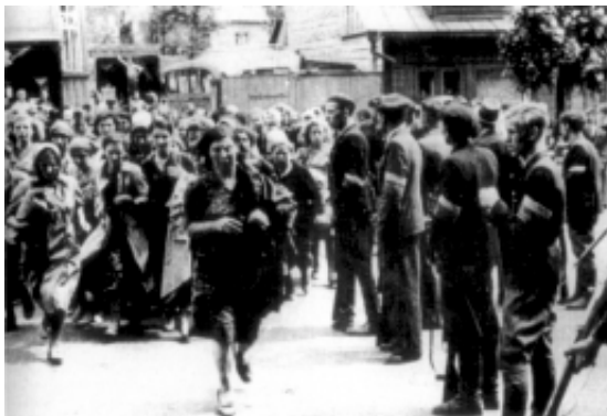
Єврейські жінки в оточенні литовських поліцаїв. (З каталогу "Jewish Life in Lithuania, Вільнюс, 2001)