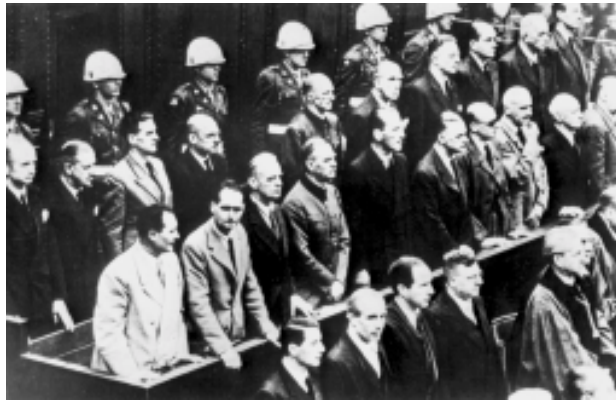
Міжнародний трибунал у Нюрнберзі, 1946 р.

Я знавал одного бодренького старичка из России, который возил ядерные ракеты на Кубу. Его вовсе нельзя назвать фанатиком – особенно сейчас, когда род-