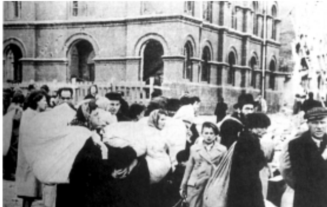
Переселення євреїв у гетто, м. Дрогобич, 1942 р. (З книги І.А.Альтман "Історія Голокосту на території ССРСР", Москва, 2001)

* Поставленна в скобки фраза вычеркнута в тексте чернилами.