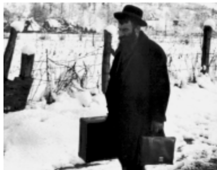
Західна Україна, початок 40-х рр. (з фотоальбому Романа Вишняка "Wo Menschen und Bucher lebten", Мюнхен, 1993)