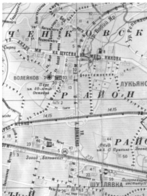
Рис. 4 (Карта Киева, 1919г.)

Юлия Смилянская, научный сотрудник Центра