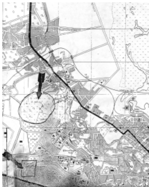
Рис. 2 (ЦГАВОВУ, ф. 4620, оп. 3, спр. 243а)