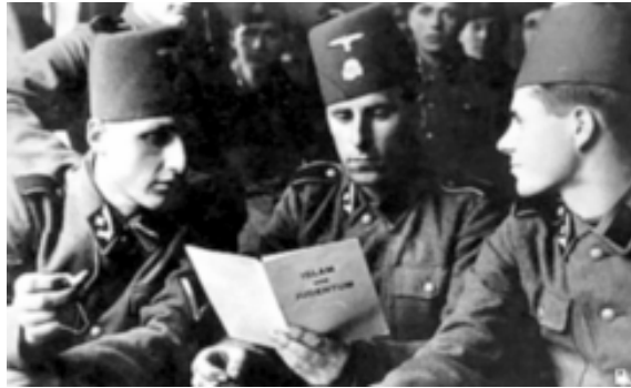
Изучение книги "Ислам и еврейство" на политзанятиях мусульман-боснийцев

Ієрусалимський муфті аль-Хусейні особисто учавствовав в створенні цієї дивізії СС, вел пропагандистську роботу з солдатами-боснійцями. На політзаняттях есэсовці-мусульмане вивчали книгу «Іслам і єврейство». Коли в дивізію був доданий полубандитський трохтисячний отряд Мухаммеда Хаджіфендіча із Тузлы, общее число солдат в «Хандшарі» досягло 26 тисяч чоловік. Весь «бойовий» шлях дивізії був зв'язаний з геноцидом сербів і євреїв, а також з боротьбою проти партизан Тито.