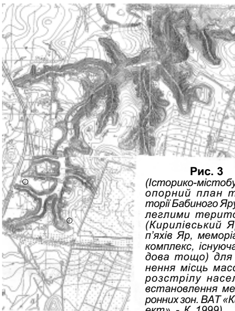
Рис. 3 (Історико-містобудівний опорний план території Бабиного Яру з прилеглими територіями (Кирилівський Яр, Реп'яїв Яр, меморіальний комплекс, існуюча забудова тощо) для уточнення місць масового розстрілу населення, встановлення меж охоронних зон. ВАТ «Київпроект». - К. 1999)

К сожалению, пока больше нет никаких уточняющих сведений. Мы знаем лишь, что на расстрел в сентябре - октябре люди шли мимо Еврейского кладбища, поворачивали направо и спускались вниз. Что расстреливали, как минимум, в двух оврагах, расстрельная стена оврага