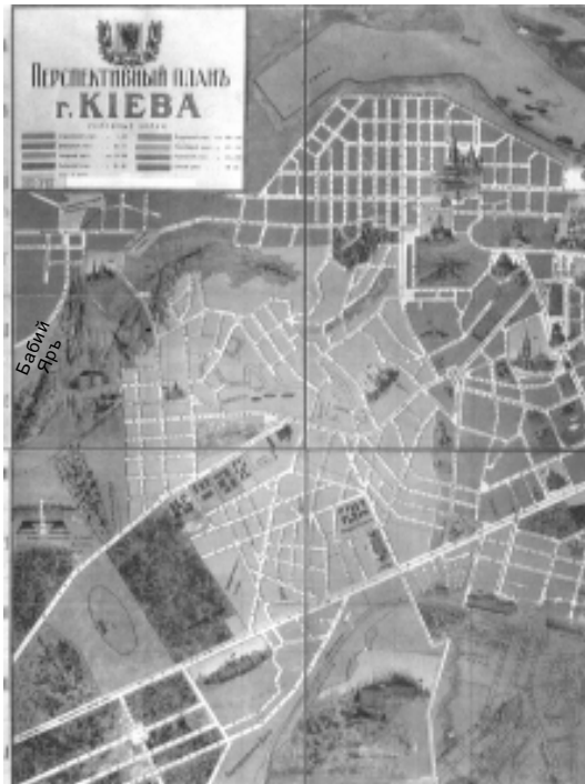
Рис. 1 (Київ. Історичний огляд (карти, ілюстрації, документи), відп. ред. Кудрицький А.В. - К. 1982)