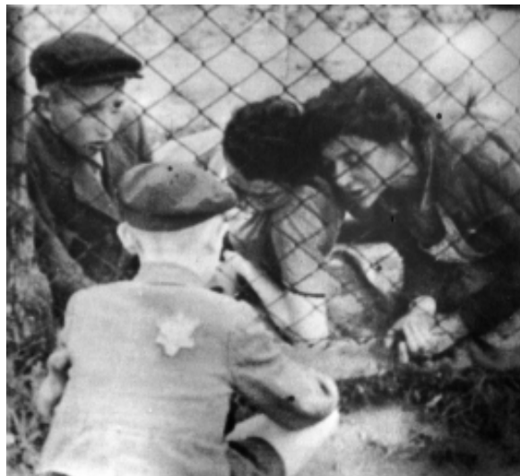
Гетто в Лодзі, сентябрь 1942 г. Мальчик прощается со своей семьей. С 5 по 12 сентября больших, стариков и детей до 10 лет депортируют в лагерь уничтожения...

Цвєтан Тодоров, директор Національного центру наукових досліджень (Париж)