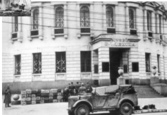
Сентябрь 1941 г. Немецкие солдаты возле вынесенных из Музея Ленина ящиков с тринитротолуолом

Оперативная группа Ц в радиogramме в Берлин кратко доложила о проделанной до этого дня в Киеве работе. В радиogramме, воспроизведенной в «Донесении о событиях в СССР» № 97 от 28.9.1941 г., в частности, говорится: «Передовая команда IV-A с 19.9. непосредственно со сражающимися войсками в Киеве. Штаб группы прибыл 24.9. В качестве резиденции штаба группы предусмотрено здание НКВД, улица 24-го Октября. Сегодня утром [т.е. 26.9. – А.К.] здание очищено и временные квартиры оборудованы в бывшем царском замке. Город при вступлении войск почти не разрушен. На главных улицах были устроены многочисленные баррикады и заграждения для танков. Кроме того, внутри города имеются мощные оборонительные сооружения. 20.9. взлетела в воздух цитадель, при этом погибли артиллерийский командир и штаб. 24.9. сильный взрыв в помещениях фельдкомендатуры, возникший при этом пожар еще не потушен. Пожар охватил центр. Разрушены самые ценные здания. Борьба с пожаром до сих пор почти безрезультатна. Теперь взрывы для локализации. Огонь у самого ведомства. По этой причине вынужденная очистка. Из-за взрывов значительное повреждение здания. Взрывы еще продолжаются, как и возникновение пожаров. До сих пор в зданиях обнаружены 670 мин. Согласно обнаруженному плану заминированы все общественные здания и места, в том числе будто бы новое здание ведомства. Здание тщательно обыскано. При этом обнаружены и уничтожены 60 бутылок взрывчатой смеси Молотова. В музее