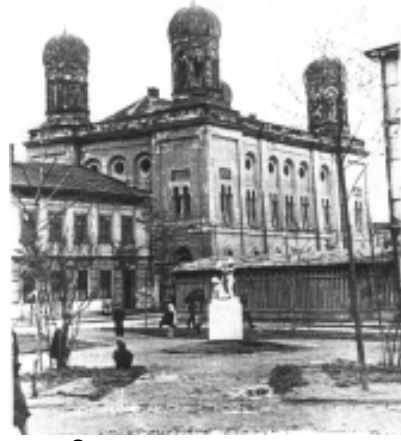
Станиславская синагога сразу после войны

В 1943 г. продолжались массовые казни еврейского населения на кладбищах Станислава и близлежащих местечек. Одновременно производились депортации нескольких тысяч евреев в Белжец. К лету 1943 г. Станислав и другие города области были окончательно очищены от евреев. В «окончательном решении еврейского вопроса» в г. Станиславе и близлежащих местечек активно участвовали офицеры СС и местного гестапо: начальник местного отделения гестапо гауптштурмфюрер Ганс Кригер, его заместитель унтерштурмфюрер С. Бранд, офицеры СС Тауш, Даус, Миллер, Маурер, Шотт и другие. В казнях невинных людей участвовали комендант немецкой полиции Станислава Штреге, его заместители Грим и Зайдель, начальник украинской полиции Станислава И. Банах, немецкий окружной староста доктор Альбрехт и его помощники, а также местные полиция И. Гойда, А. Невера, М. Майковский и другие.