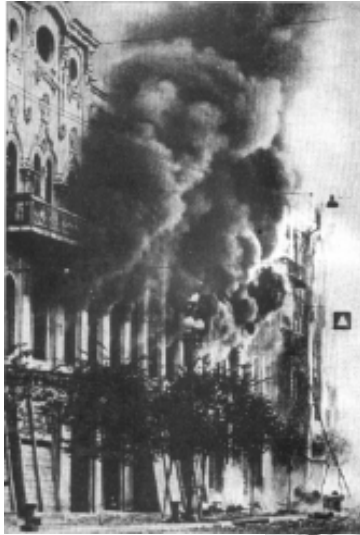
24 сентября 1941 г. Горит дом на Крещатике, 25