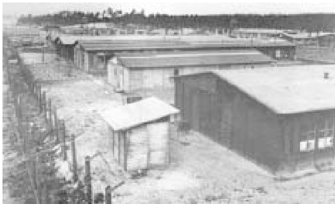
Концентраційний табір Койзервольд, 1944 р. (з методичного посібника "Холокост", Рига, 2001)

Не все дома евреев были переданы местным жителям. В 1942-1944 г. в Лудзе появляются и другие хозяева. Вначале – это жители из окрестных деревень: они либо покупают, либо арендуют дома