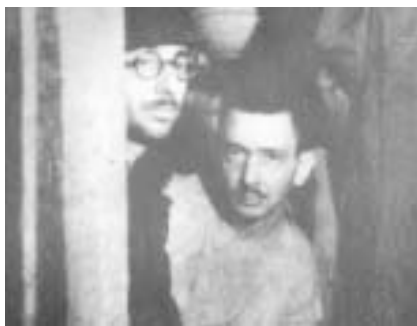
Євреї Ліснаї, 1942 р. (З методичного посібника "Холокост", Рига, 2001)