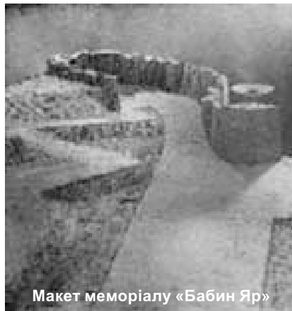
Макет меморіалу «Бабин Яр»

«... Может быть, есть пятьдесят праведных в этом городе, неужели погубишь и не простишь места этого ради пятидесяти праведных в нем?..