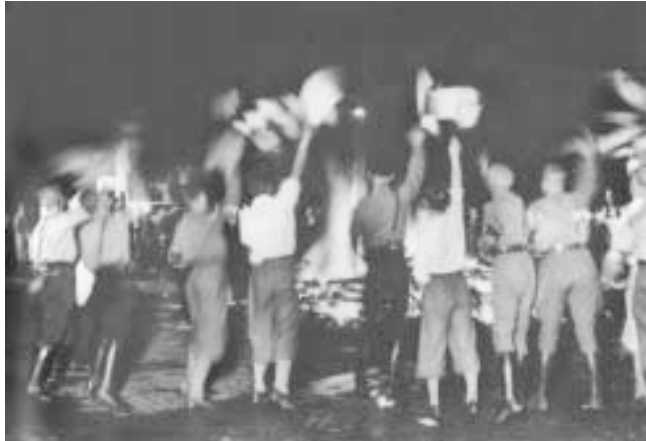
Спадения книг єврейських авторів, Берлін, 1933 р. (3 книги «Передайте об этом детям вашим...», Москва, 2000)

Оставляем на совести автора грубые выражения, которые, на наш взгляд, не украшают научной дискуссии, а также свидетельствуют о не совсем гуманных взглядах автора. Особенно следует отметить режущее слух выражение «болтался на виселице», даже если речь идет о нацистском преступнике.