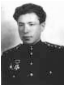
Євреї – воїни Радянської Армії (З книги Ф.Винокурова "Євреї Вінничини в період Другої світової війни", т.3, Вінниця, 2000)