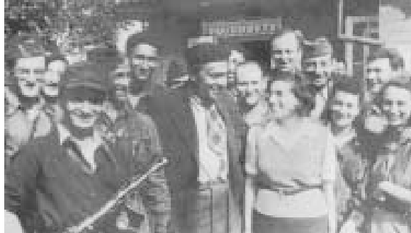
Ілля Ернбург серед партизанів-євреїв, яким вдалося вирватися з Віленського гетто.