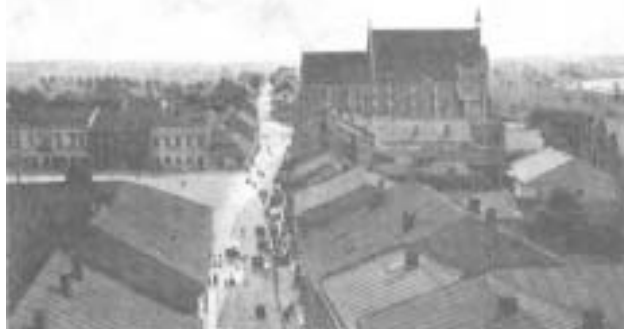
Освенцим до війни