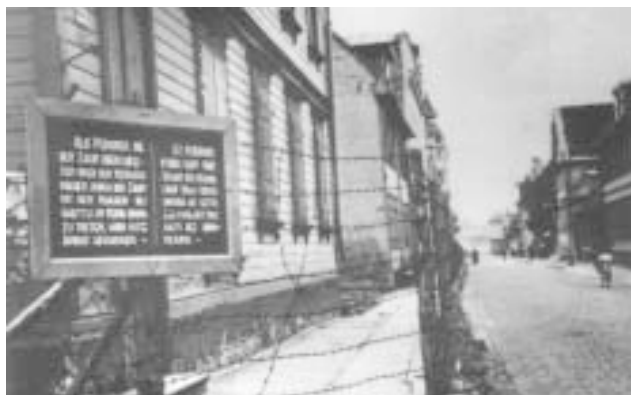
Район гетто в Ризі.

(З методичного посібника “Холокост”, Рига, 2001)