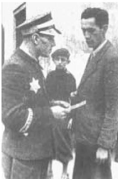
Еврейський поліцейський у гетто, 1942 р. (з книги “The Jews of Cracow”, Краків, 1996)