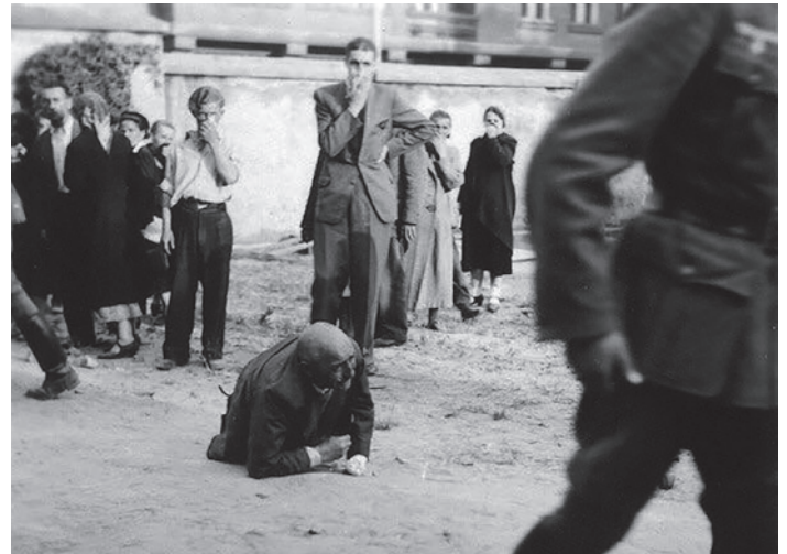
Фотографії, зроблені у внутрішньому дворі тюрми на Лонцького