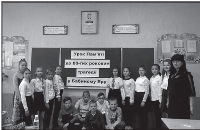
Урок пам'яті у Райгородському ліцеї

пам'яті жертв Голокосту, що розташований у с. Острожець Дубенського району Рівненської області на місці масового розстрілу і захоронення 9 жовтня 1942 р. понад 800 євреїв – чоловіків, жінок і дітей.