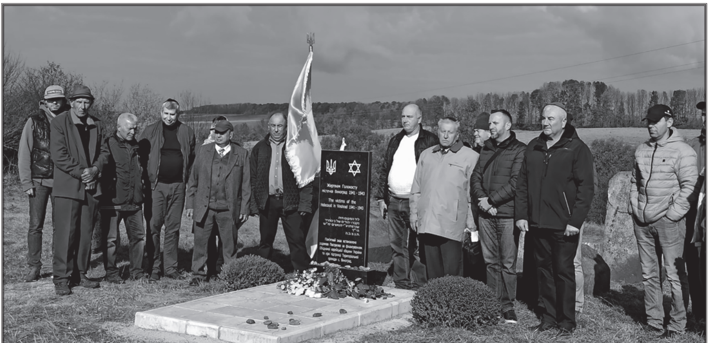
Під час відкриття пам'ятного знака у с. Виноград Черкаської області

Відомо, що в Охтирці розстріляли 32 євреї, не пожаліли окупанти навіть чотиримісячну дитину. Зі слів свідків, були випадки, коли приречені на смерть виштовхували своїх дітей із колони, а місцеві жінки ховали їх під довгі спідниці. Так урятували маленьку дівчинку, яка згодом закінчила школу в Охтирці, а пізніше вступила до Ленінградського вишу. Вже зі своїм внуком вона приїздила до рідного міста, відвідувала місце масового поховання невинних жертв злочинного режиму.