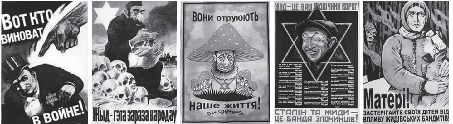
Німецькі пропагандистські плакати