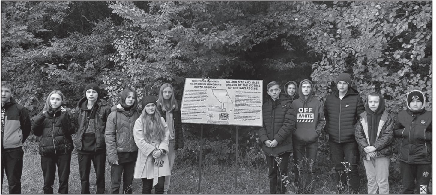
Під час церемонії у с. Райгород