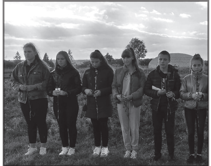
Учасники меморіального заходу у с. Виноград Черкаської області