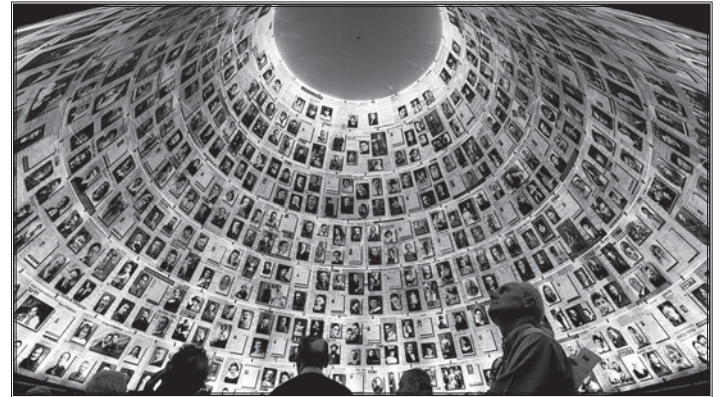
Яд Вашем – Меморіальний комплекс історії Голокосту

Відповідно до даних Яд Вашем, за кількістю «праведників» Україна перебуває на 4-му місці після Польщі, Нідерландів і Франції.