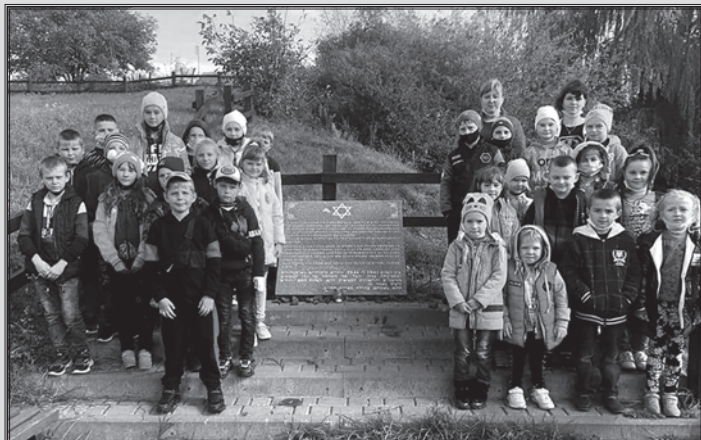
Меморіал у с. Острожець

пам'яті жертв Голокосту, що розташований у с. Острожець Дубенського району Рівненської області на місці масового розстрілу і захоронення 9 жовтня 1942 р. понад 800 євреїв – чоловіків, жінок і дітей.