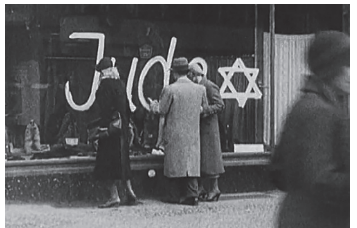
Фотографії, зроблені на вулицях міст Німеччини й Австрії