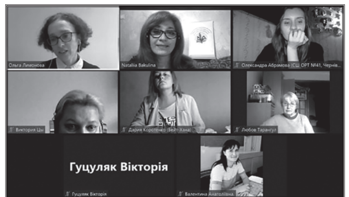
Ведучі й учасники вебінару