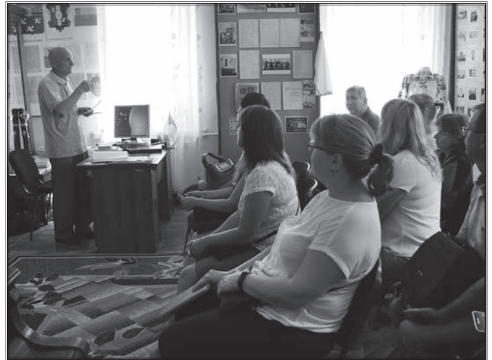
Експедиція до краєзнавчого музею в Радомишлі

у життя, систематизувати зібрані матеріали, встановити зв'язки з людьми, що виїхали за кордон, але цікавляться спрощенням меморіалів і можуть надати інформацію та допомогу учням і вчителям у дослідницькій роботі. Висловлювалися побажання залучити до проекту студентів, односельців і місцеві громади та представників влади; не допустити спотворення історії. І вже традиційно очікувалося приємне спілкування і позитивні емоції, які дають відчуття задоволення від виконаної доброї справи.