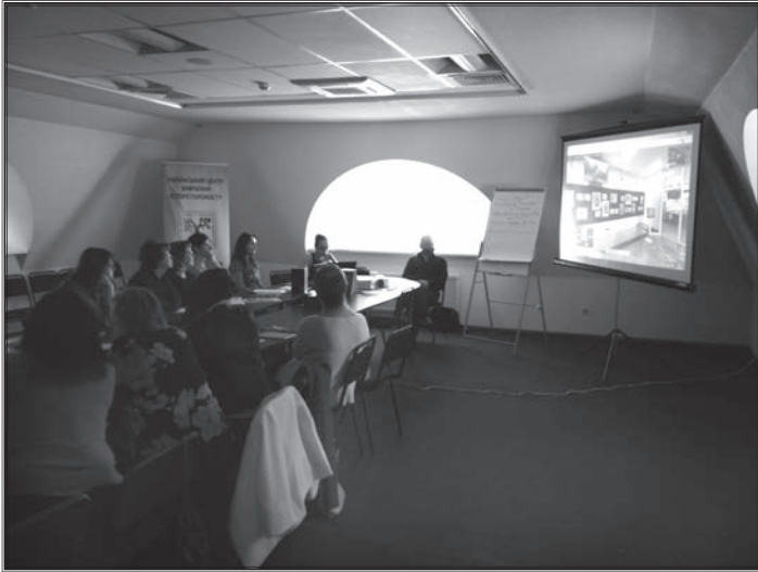
Семінар-презентація у Музеї історії м. Києва

та ставали в майбутньому співавторами. Основну увагу приділили ознайомленню з матеріалами та методичними можливостями їх використання, а також обговоренню методики використання матеріалів виставки, фільму й путівника у навчально-виховному процесі.