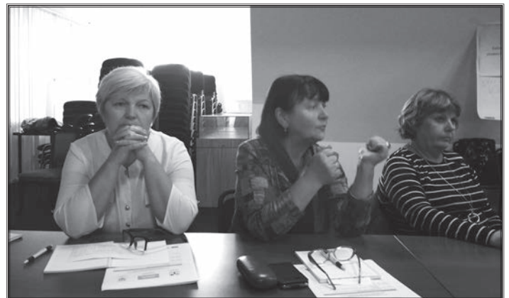
Учасники семінару під час дискусії