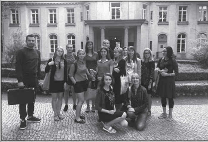
Учасники науково-методичного семінару

чення історії Голокосту спільно із «Будинком Ванзейської конференції». Ідея проекту проста, але разом з тим надзвичайно дієва: надати історикам, філософам, журналістам, студентам, викладачам середньої та вищої школи – тобто тим, хто своєю чергою є певними агентами впливу у своєму професійному колі, – можливість побачити на власні очі й порівняти два підходи до пам'ятання тоталітаризму. Наші учасники порівнюють побачене у Києві та Берліні, а я можу також до цього додати часове зіставлення. На мою думку, результати цієї та минулорічної поїздки різні, хоча значна частина програми і залишилася тією самою.