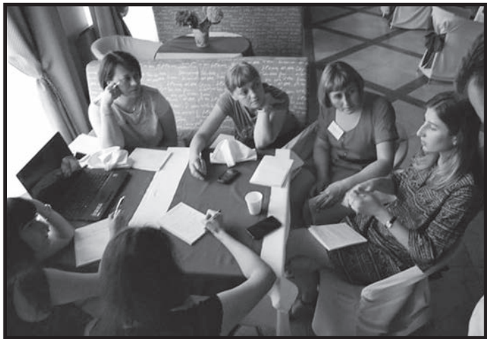
Робота в групах

Робота під час семінару-школи з історії Голокосту в Україні перевершила очікування, бо ми мали змогу побачити цю тему з різних кутів зору: загальноєвропейський контекст, відображення у мистецтві, літературі, кіно.