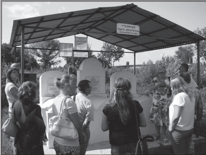
На старому єврейському кладовищі в Радомишлі