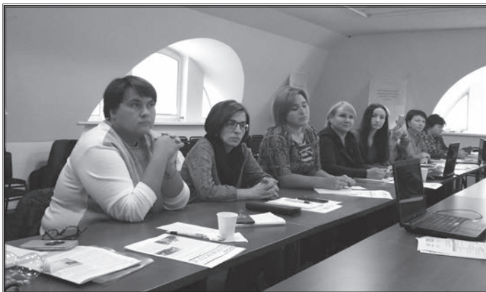
Під час роботи семінару

Особисто я знайшла відповіді на складні запитання, зокрема щодо особливостей використання віртуальних, відео та інтерактивних ресурсів для розкриття проблемних питань, пов'язаних із пам'яттю про Бабин Яр. Потрібно відзначити продуктивність дискусії «Актуальність пам'яті Бабиного Яру та особливості меморіального простору», де учасники мали