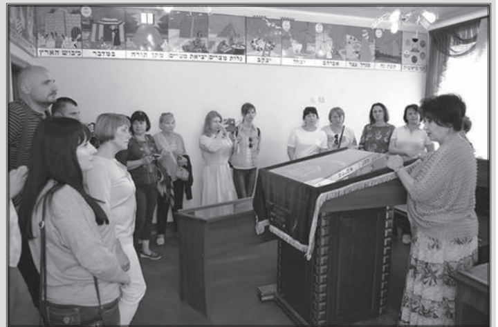
Під час візиту до гімназії «Ор Авнер», м. Житомир

Цікаві лекції гармонійно перепліталися із практикумами та обговореннями. Всі викладачі були відкриті до дискусії, давали ґрунтовні пояснення на запитання учасників. Лекції не тільки поглиблювали та розширювали наші знання із цієї тематики, а й зачіпали багато інших проблем, давали новий погляд на певні події, ламали усталені стереотипи. Кожен викладач рекомендував багато матеріалів для подальшого вивчення певного питання. В результаті у мене склався такий собі «список очікування», опрацювання якого займе ще багато часу.