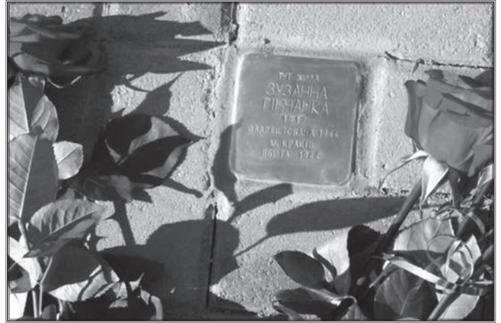
Польська поетеса Зузанна Гінчанка загинула в молодому віці тільки тому, що народилася єврейкою. На місці сучасної Театральної площі колись стояв будинок її бабусі, в якому минули дитячі роки Зузанни Гінчанки. Тут ми заклали перший «камінь спотикання»