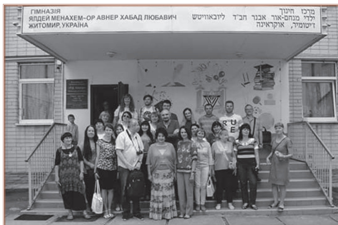
Учасники Літньої школи

2–7 липня 2018 р. у м. Житомирі відбувся щорічний освітній семінар-школа з історії Голокосту в Україні та проблем викладання цієї тематики в школах України. Організатором літнього семінару-школи є Український центр вивчення історії Голокосту (УЦВІГ) у співпраці з Меморіалом «Яд Вашем» (Єрусалим) та за підтримки Асоціації єврейських організацій та общин України (Ваад України) і посольства Держави Ізраїль в Україні. Пропонуємо відгуки учасників Літньої школи.