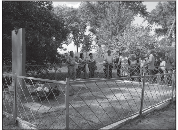
Місце масового розстрілу євреїв Радомишля

ють емпатію. Велику увагу було приділено методиці роботи з документами.