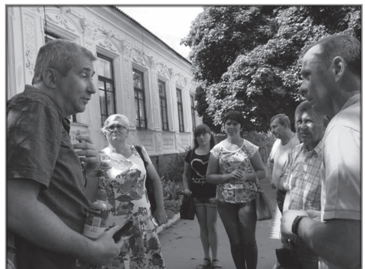
Експедиція вулицями Радомишля