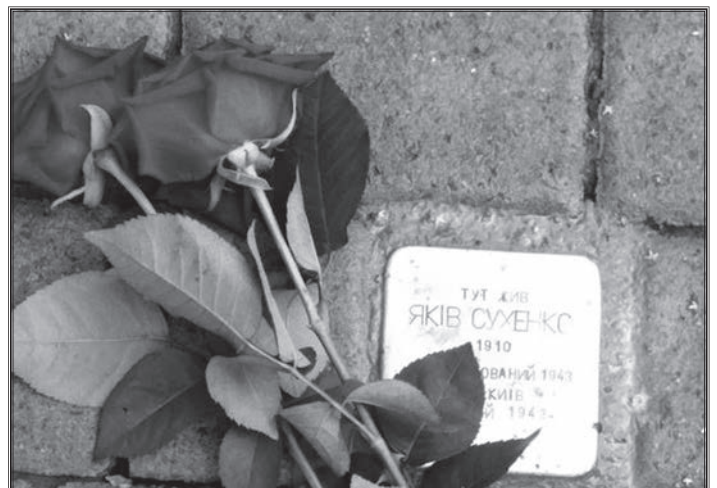
«Камінь спотикання» українцеві, Праведнику народів світу Якову Сухенку, який постраждав за те, що рятував людські життя. Він представник тої незначної кількості людей, які в умовах геноциду обрали найблагородніший спосіб поведінки – допомагати жертвам