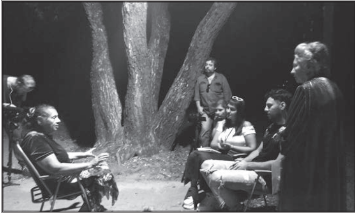
Під час зустрічі