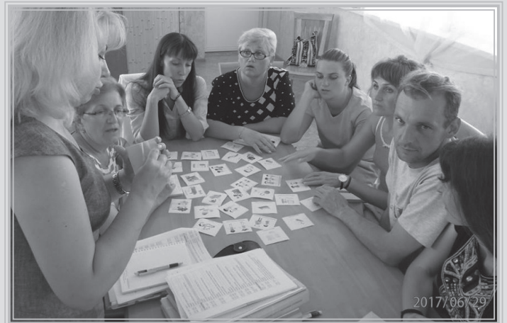
Під час роботи в групах

здобути знання. Формат майже кожної лекції передбачав активну участь аудиторії в роботі, спільний пошук відповідей на вкрай неоднозначні питання з історії євреїв на українських землях, проблеми тоталітаризму і теоретичного визначення понять «геноцид», «Голокост», «нацизм»; з'ясування причин Голокосту і причин та мотивів поведінки нацистів, місцевого населення (українців, поляків, євреїв); історичний контекст та перебіг Голокосту в Німеччині та на українських землях; поведінка особи в умовах екстремальних ситуацій (екстрем); боротьбу євреїв з Голокостом (розвінчання стереотипу про «єврея-жертву»); Голокост в масовій культурі (кіно, літературі). Стане в нагоді досвід участі в заняттях з різними типами джерел і їх використання в навчальній діяльності, дискусії, практичне використання різних методик роботи з ними в навчанні історії Голокосту.