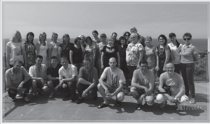
Учасники Літньої школи

викладання емоційно травматичного матеріалу, повсякденного життя в умовах екстремі та ін. У ході бесід, дискусій, обговорень, інтерактивних групових форм роботи учасники семінару мали можливість напрацювати практичні навички і вміння з методики викладання даної теми.