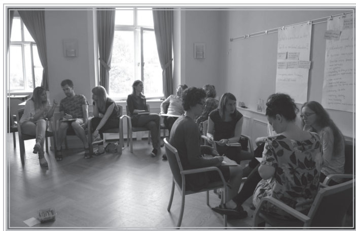
Робота в групах