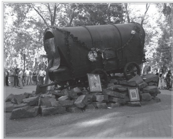
Фото: Олена Орлова, ІРЦ «Правовий Простір». «Ромська кибитка».

Кожен із гостей, які брали слово під час заходу, доповнював своїми думками та фактами картину великої