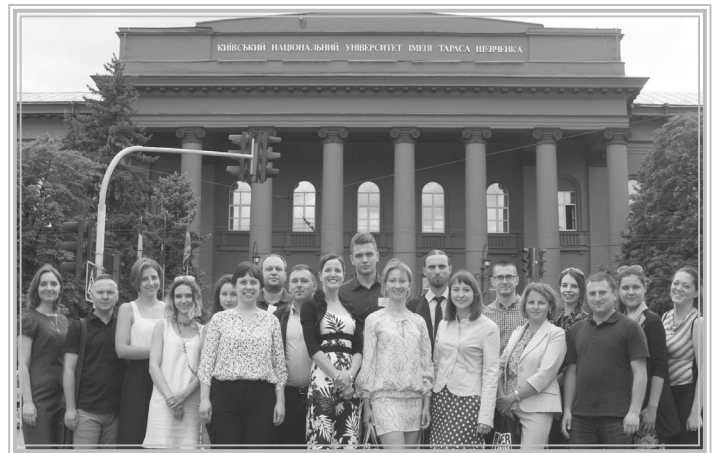
Учасники Літньої школи

Під час численних обговорень лектори та учасники школи підкреслювали, що Голокост це невід'ємна складова історії України, її наукове вивчення, викладання та меморіалізація є надважливим для сучасного українського суспільства. Завдяки літній школі «Історія Голокосту та пам'ять в Україні», яку вже вдруге прийняв в своїх стінах Київський національний університет імені Тараса Шевченка, молоді дослідники, безумовно, отримали широкі можливості для початку чи вдосконалення власних наукових розвідок.