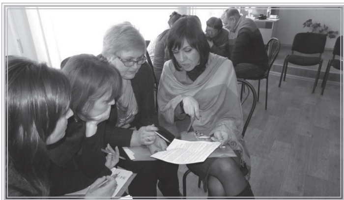
Робочі моменти семінару

Протягом 2016-2017 навчального року в різних містах України проходили семінари по Проекту поширення освітніх матеріалів з протидії антисемітизму, ромофобії та різним формам ворожнечі.