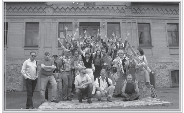
Синагога у Сквирі

Сквирська династія була відгалуженням чорнобильської хасидської династії. Її засновник — ребе Іцхак був одним з восьми синів Мордехая Тверського, засновника династії чорнобильських хасидів. Сини Мордехая, у свою чергу, стали засновниками різних хасидських громад у північних та центральних областях України.