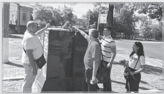
Фото: Федір Кондур, Ромське радіо Chiriklo. Учасники акції біля меморіального знаку в Одесі.

Міжнародний день пам'яті жертв Голокосту ромів відзначили в Одесі пам'ятною акцією. Зранку 2 серпня волонтери та співробітники Правозахисного ромського центру поклали квіти до меморіалу жертв геноциду ромів у сквері «Хворостина».