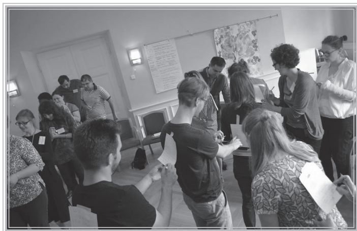
Під час тренінгу

Увесь третій день тренінгу група провела в Рогожніці, де спочатку відвідала екскурсію музеєм колишнього концентраційного табору Гросс-Розен, а потім прослухала лекцію про єврейські жертви табору від співробітниці музею,