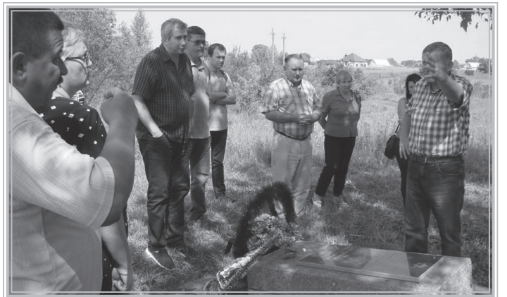
Під час екскурсії