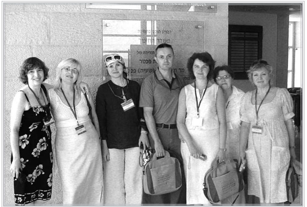
Учасники конференції. В центрі – автор статті

Друга половина дня проходила у формі практичних занять, місцем проведення яких слугували навчальні аудиторії «Яд Вашем». Це була, мабуть, найкорисніша для практикуючих учителів частина конференції, адже кожному педагогу хотілося познайомитися з конкретним досвідом своїх колег з іншої країни. І це, потрібно відзна-