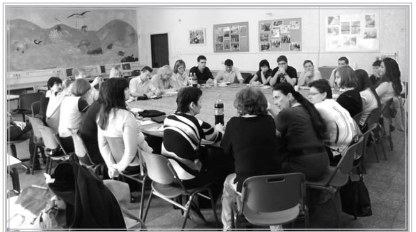
Група вчителів з України під час відвідання школи в Єрусалимі

Свою лекцію прочитав також відомий канадський історик українського походження М. Царинник. Пан Марко повідомив, що зараз працює над новою книгою про ставлення ОУН та УПА до євреїв, використовуючи архівні матеріали «Яд Вашем». Свою лекцію пан Марко прочитав у властивій тільки йому емоційній імпрезі. На превеликий жаль, його виступ був обмежений часовими рамками, тому автор тільки висвітлив політику ОУН стосовно євреїв у період з 1929 по 1942 рр. Пан Царинник показав еволюцію антисемітського сегменту в ідеології ОУН в цей період. Він переконував, що від самого створення організації антисемітизм не грав значної ролі в її ідеології, але пізніше під впливом (мабуть) нацистської Німеччини перед початком Другої світової війни навіть члени ОУН, які мали певні сентименти у ставленні до євреїв наприкінці 1920-тих – на початку 1930-тих – їх остаточно втратили та перейшли на антисемітські позиції. Тут пан Царинник навів приклад М. Сціборського, який у 1929 році написав статтю «Український націоналізм та жидівство», де закликав євреїв до співпраці, а 1939 році став автором проекту «Конституції» оунівської української держави, де євреї не були повноправними громадянами та підлягали «окремому параграфу».