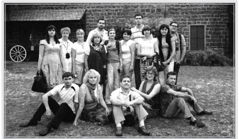
Група 2010 року

З 9 по 19 листопада 2010 року відбувся П'ятий щорічний навчально-методичний семінар з історії Голокосту в Європі для викладачів історії українських шкіл. До групи ввійшло 16 учасників, які представляли середні навчальні заклади багатьох областей України та Республіку Білорусь. Семінар став можливим завдяки зусиллям Українського центру вивчення історії Голокосту у співпраці з «Яд Вашем» та за підтримки Євразійського єврейського конгресу.