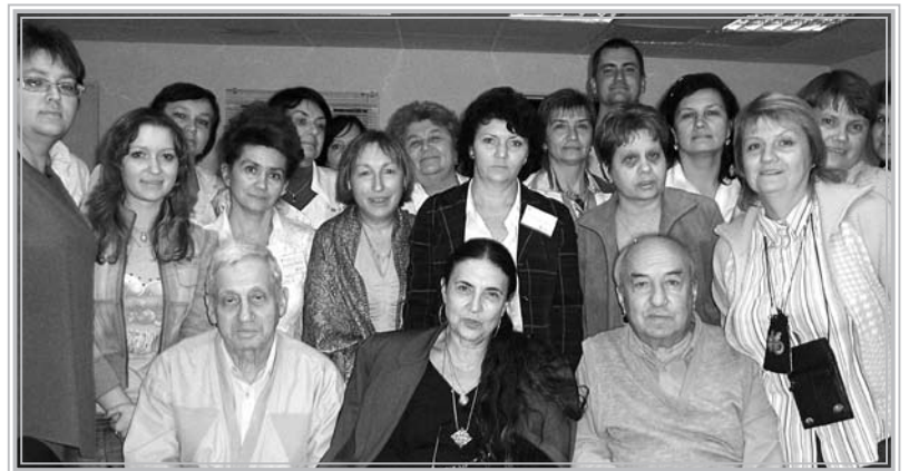
Група 2008 року

Наша учительская работа по теме Холокоста в Украине была разной по содержанию и форме (кураторство и прове-