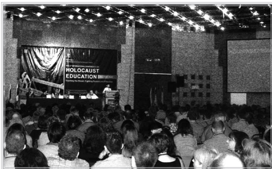
Робочий момент конференції «Боротьба проти расизму і упереджень».

викладання історії Голокосту «Боротьба проти расизму і упереджень», на яку було запрошено близько 800 педагогів з 53 країн світу. Це найбільша за кількістю учасників конференція, що була організована та проведена Меморіалом «Яд Вашем» за останні декілька років.