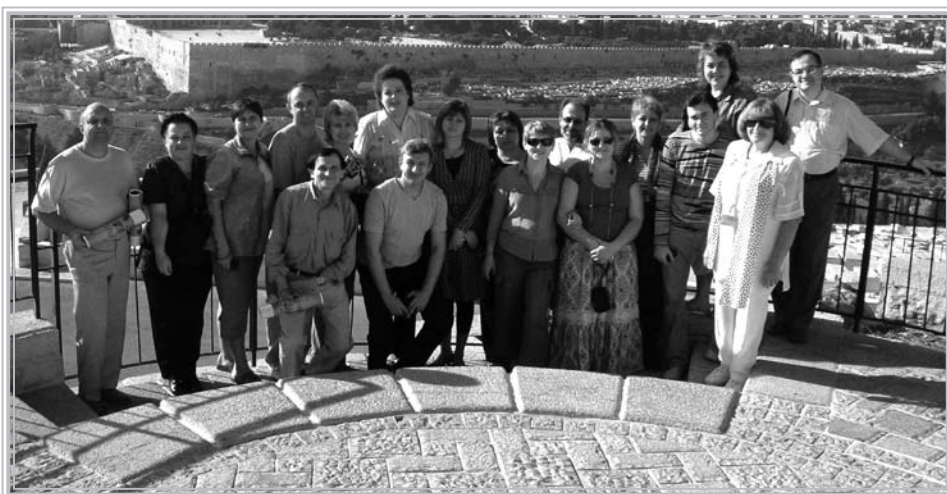
Група 2007 року

Вражає продуманість і гармонійність концепції навчальних занять, які були запропоновані учас-