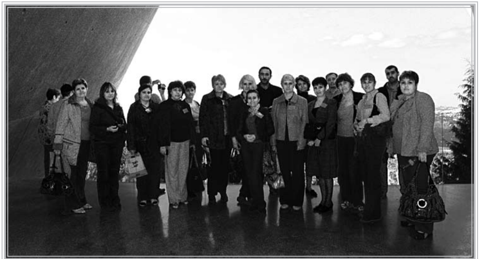
Група 2009 року

Методологічний «ключ» численних лекцій, що прочитані представниками ізраїльської наукової школи, слід, на наш погляд, вбачати в самій назві наукового центру, котрий виступав приймаючою стороною — «Яд Вашем» («Пам'ять та ім'я»). Саме такий підхід — збереження пам'яті про жертв Голокосту шляхом відтворення доль мільйонів євреїв, які стали жертвами нацизму, тих конкретних людей, чиє життя було перерване злочинцями, є, скажімо, концептуальною візиткою сучасної ізраїльської історичної школи в царині геноцидології. Наше міркування підтверджується тим фактом, що кульмінацією музею «Яд Вашем» є саме Зала імен. Справляючи високе емоційне враження на екскурсантів,