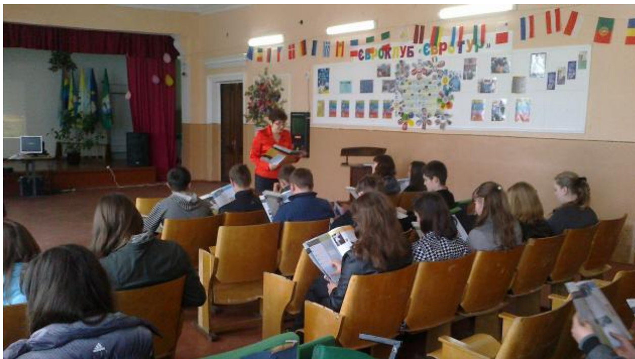
Фото з уроку: