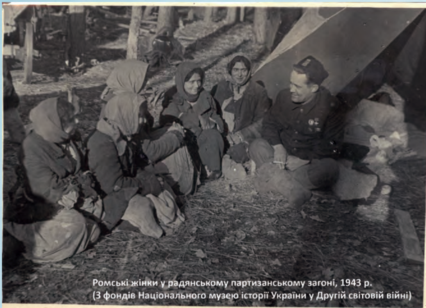
Ромські жінки у радянському партизанському загоні, 1943 р. (З фондів Національного музею історії України у Другій світовій війні)

Проект виконується спілкою «Освітня ініціатива з роботи заради миру» у Берліні спільно з Українським центром вивчення історії Голокосту в Києві. Важливою складовою є тісна співпраця з місцевими та обласними ромськими громадськими організаціями.